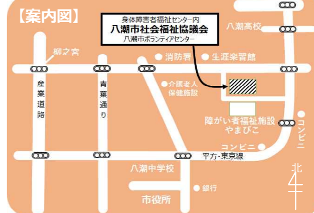
「ぬくもり」は、市内公共施設、小・中・高等学校などの協力により、各施設の窓口に設置しています。

TEL 048-995-3636 FAX 048-995-5287 ホームページ https://yashio-shakyo.jp/